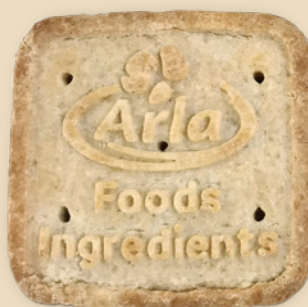
Concentrado de proteína de suero (WPC)

■ Concentrado de proteína de suero (WPC) ■ Nutrilac®